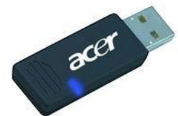
Bluetooth-USB-Dongle für ca. 20 Euro